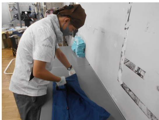
クリーニング (畳み作業)