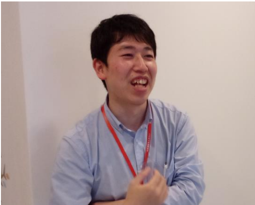
おぐり（平成24年入職）