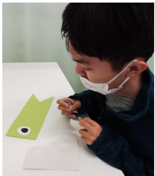
製作（こいのぼり作り）