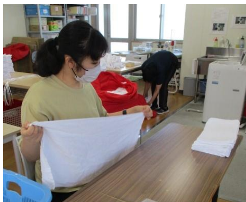
下請け作業 (タオル畳み)