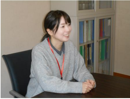
みずの（平成25年入職）